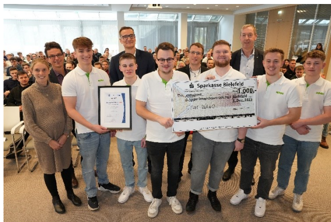
Das Siegerteam des Jahres 2023 kommt von der WAGO GmbH & Co. KG aus Minden.