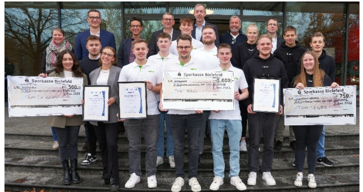
Bei der Preisverleihung 2023: Die Siegerteams mit der Jury